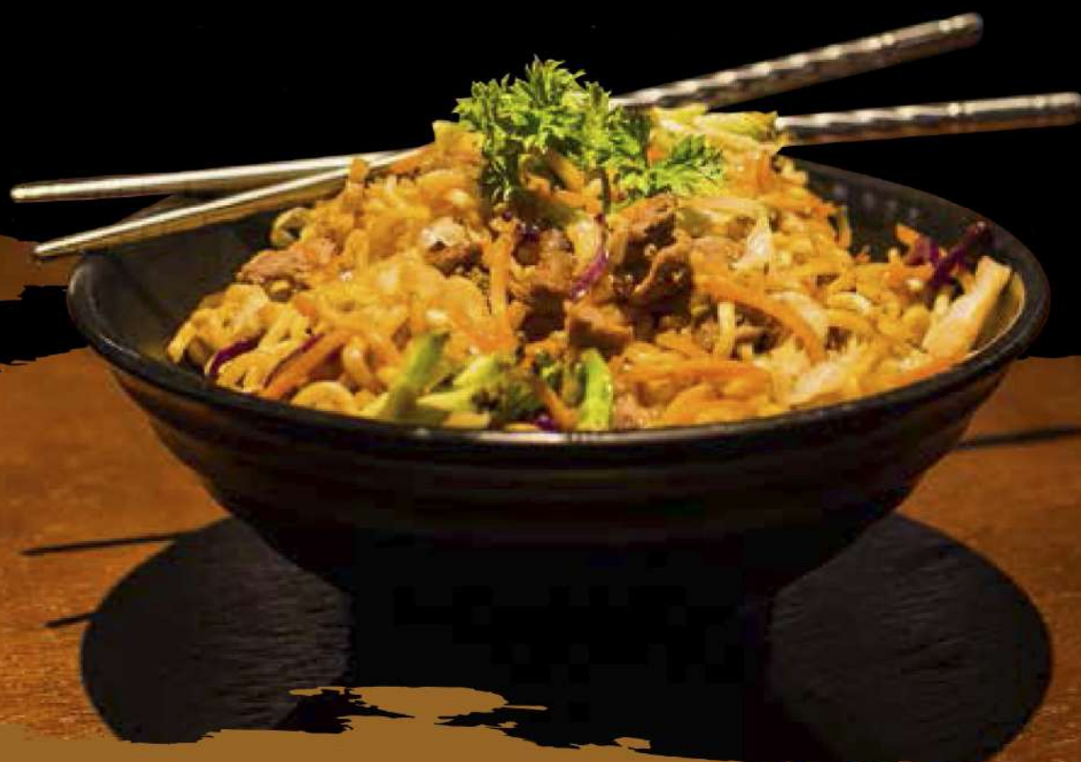
Yakissoba de Carne