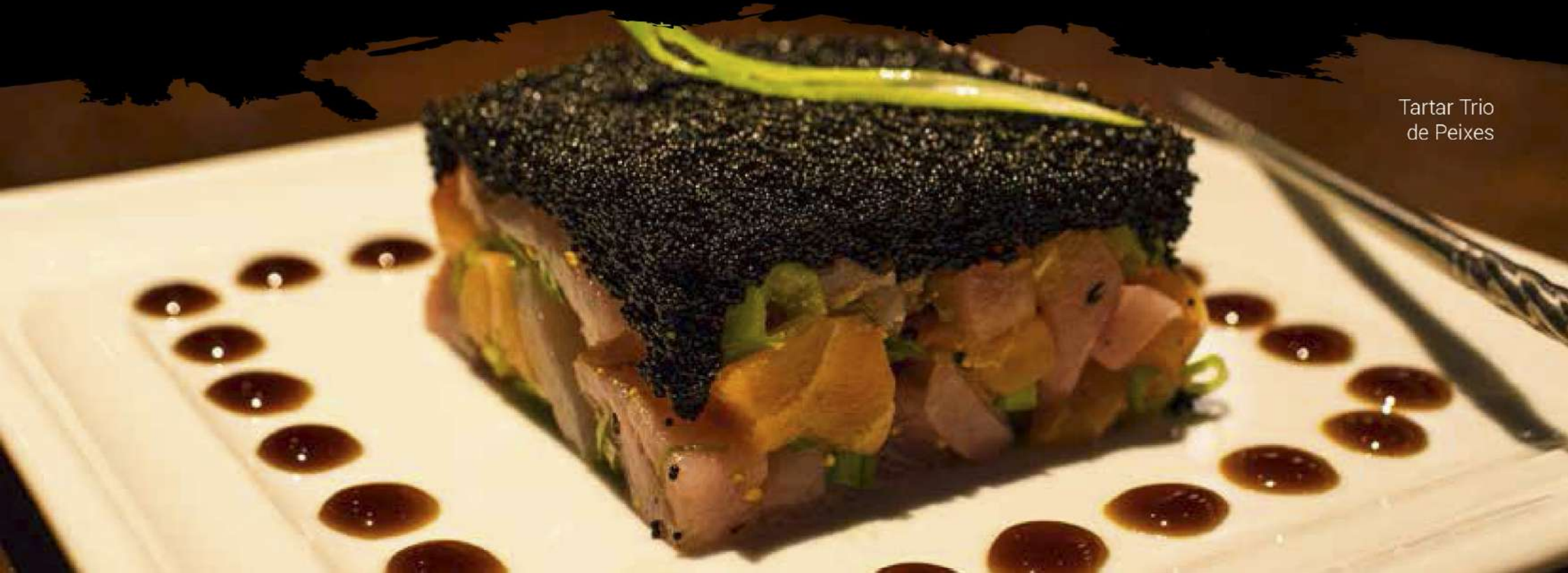
Tartar Trio de Peixes