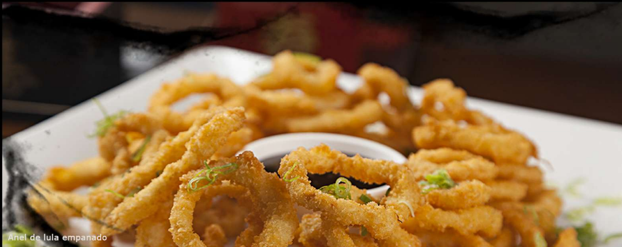
Anel de Lula empanado