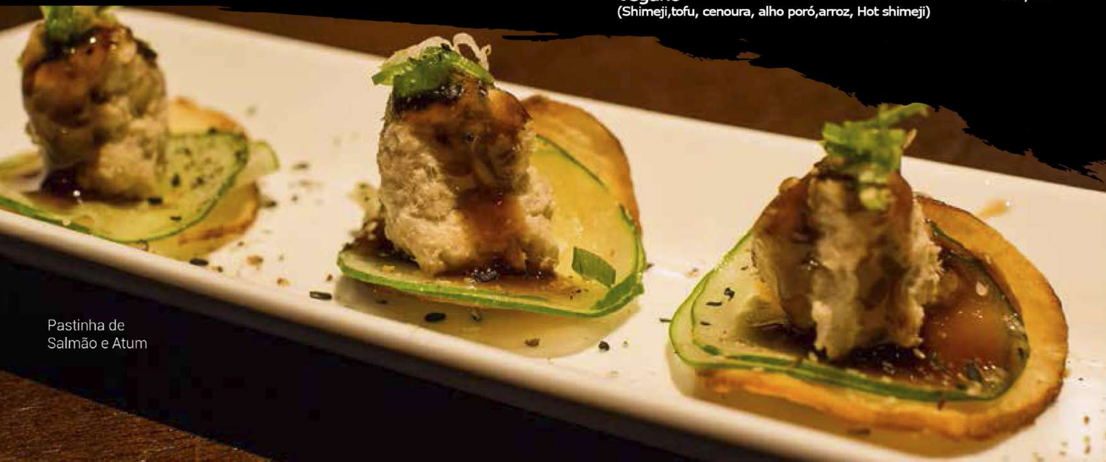
Pastinha de Salmão e Atum